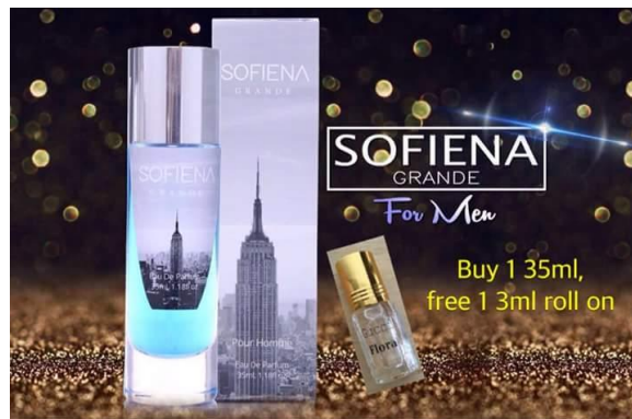
Caption : Antara perfume yang dijual